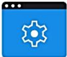
Переход на сервис МЧД