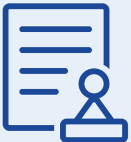
Подписание файла МЧД квалифицированной электронной подписью руководителя ЮЛ