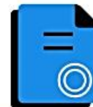
Подписанные электронные документы