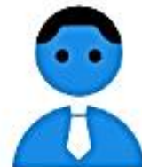
Сотрудник ЮЛ (ФЛ)